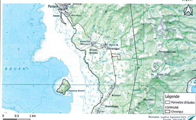
Construction de la clinique de Chirongui Situation du projet (échelle 1/25 000)